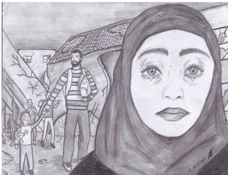
Ilustração de João Henrique Cadoni Negri

A vida no Brasil não tem sido fácil, mas podia ser muito pior se estivéssemos na Síria, ou em campos de refugiados no Líbano, ainda mais agora na pandemia, apesar das dificuldades gosto daqui e não vejo um futuro a não ser no Brasil.